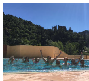
La piscine pour le plus grand bonheur des enfants