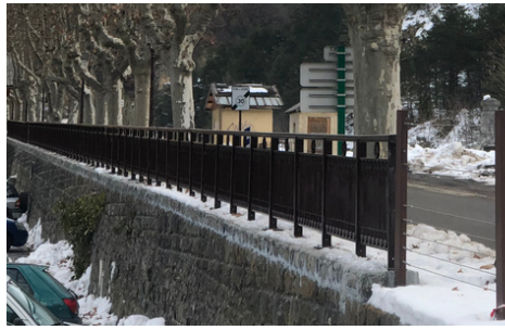
Sécurisation de l'entrée Est de Guillaumes, travaux de renforcement des routes de Villeplaine, Sauze et Bouchanières par le Département des Alpes-Maritimes