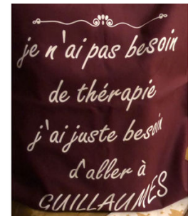
Une fréquentation touristique en hausse de plus de 12 %