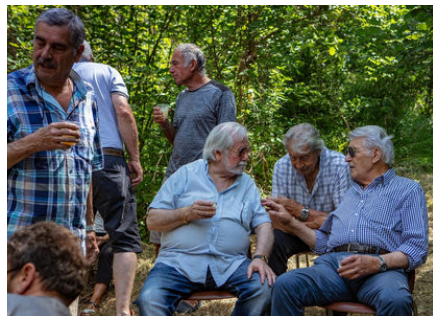
Retour à la source pour la Fête de la Saint-Jean