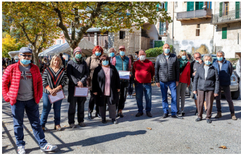
Foire agricole avec ses remises de prix et la vente aux enchères de légumes