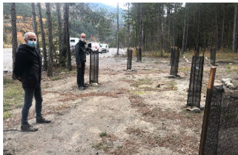
Opération 1 million d'arbres pour la Région SUD, 1000 arbres pour Guillaumes