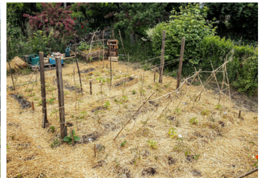
Une nouvelle façon de cultiver : la permaculture