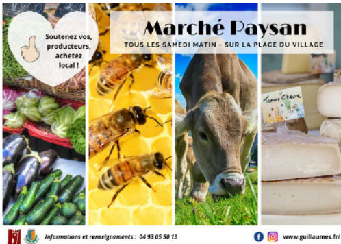
Valorisation des circuits courts