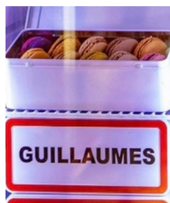
Un peu de douceur