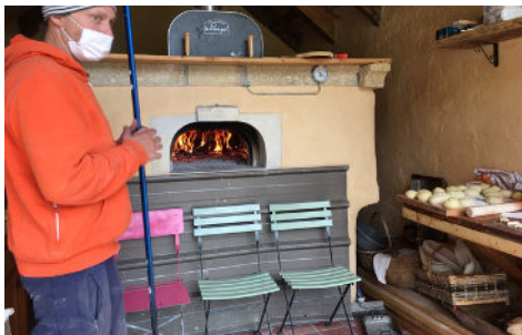
Un nouveau lieu de convivialité : le four à pain communal de Villeplaine