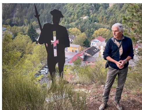
Inauguration du sentier Art, Nature et Patrimoine à Guillaumes Merci à l'association les amis du Château