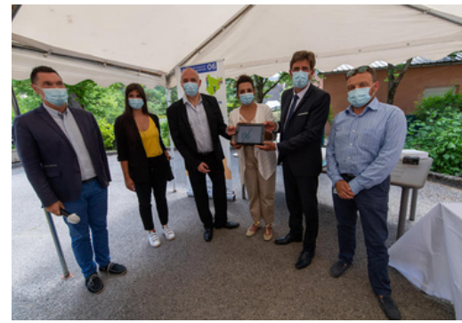
Remise des tablettes numériques à la Maison de retraite par le Président du Département des Alpes-Maritimes, Monsieur Charles Ange GINÉSY