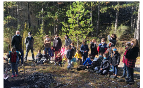
Plantation de deux arbres à la mémoire de Samuel PATY par les enfants de l' école Simone de Beauvoir