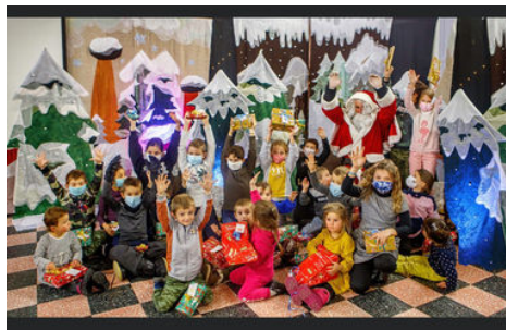
Le Noël des enfants de l'école Simone de Beauvoir