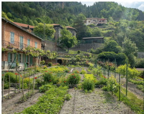
Mangeons mieux de façon plus responsable