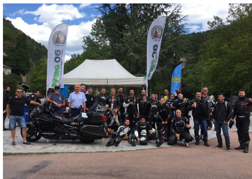
Guillaumes, halte incontournable des motards sur la route des Grandes-Alpes