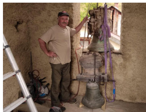
Réfection de la toiture et du clocher de Saint-Brès