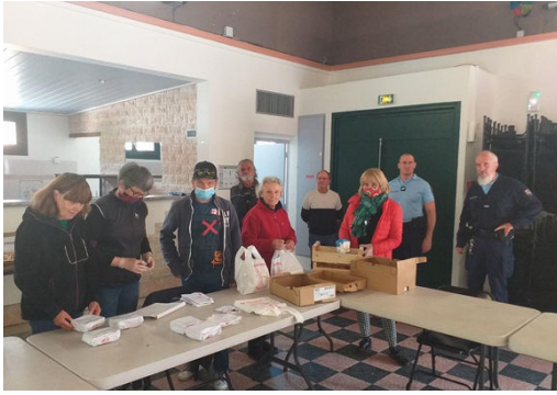
Distribution de colis alimentaires