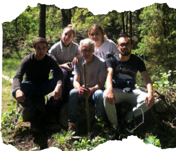
35 personnes mobilisés