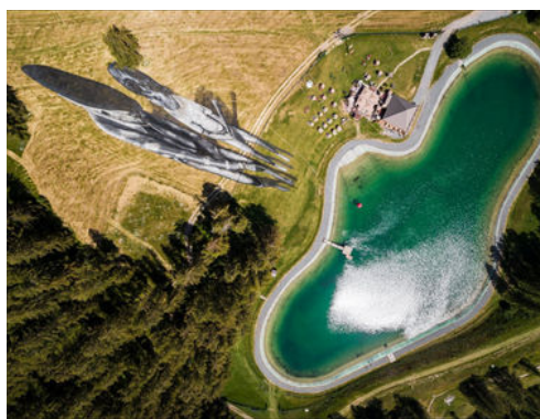
L'œuvre éphémère de Beyond CRISIS au lac du sénateur à Valberg