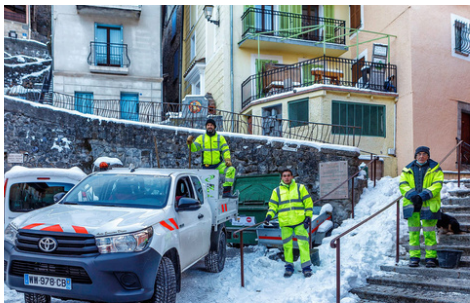
Beaucoup de neige et intervention dans les rues