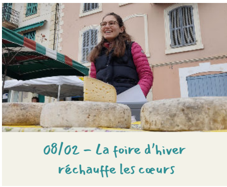
08/02 - La foire d'hiver réchauffe les cœurs