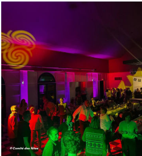
26/04 - Soirée disco à Pâques organisée par le comité des fêtes