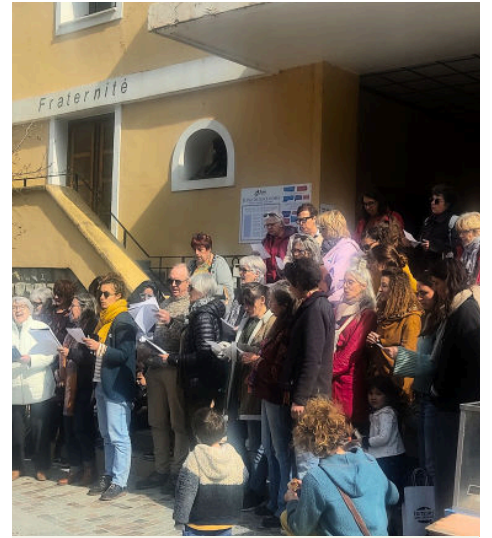
08/03 - Chants pour la Journée internationale des droits des femmes