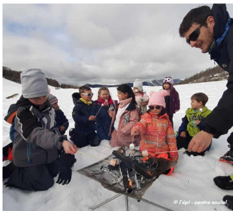
22/02 - À la conquête des sommets et des chamallows grillés avec l'épi