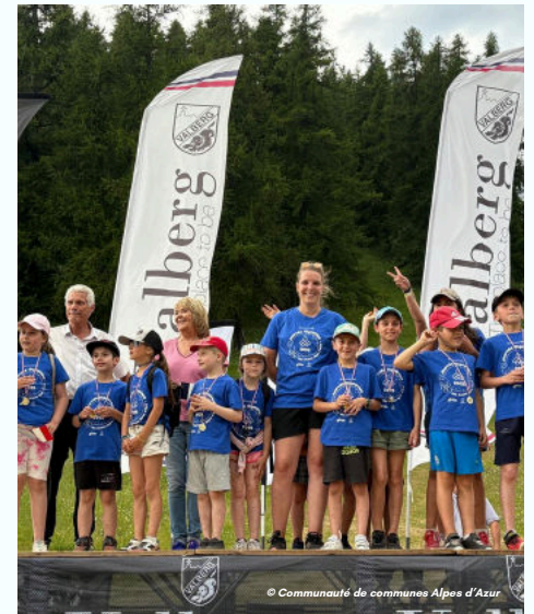
20/06 - L'école de Guillaumes décroche la 2ème place du Défi Kilomètres organisé par la Communauté de communes Alpes d'Azur !