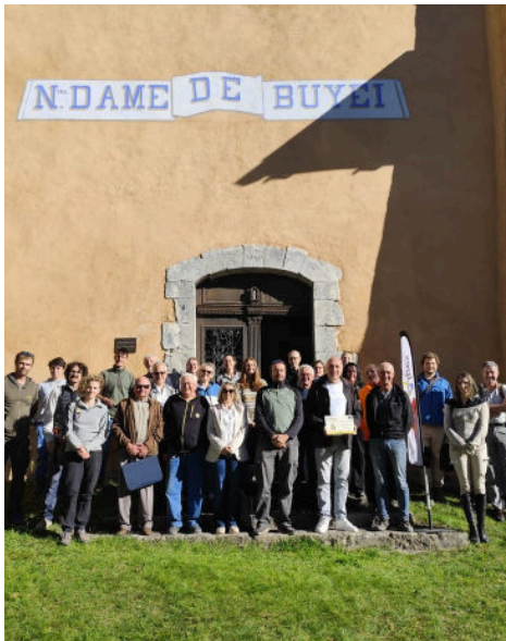
06/10 - Natura 2000 : unis pour la protection des chauves-souris