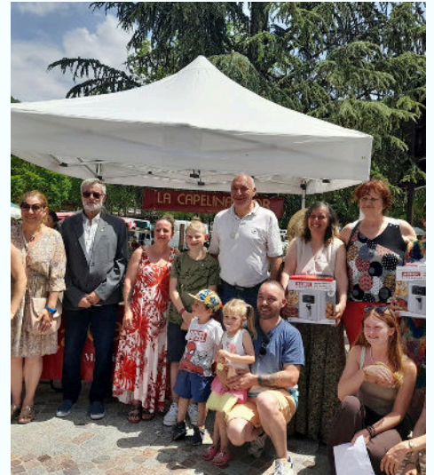
14/06 - Le Cercle de la Capelina d'Or a organisé un concours culinaire à la foire aux fleurs

Fête de la nature, chorale des enfants, transhumance, feu de la Saint-Jean : les beaux jours rassemblent autour du jeu, du sport et des traditions qui s'épanouissent au grand air.