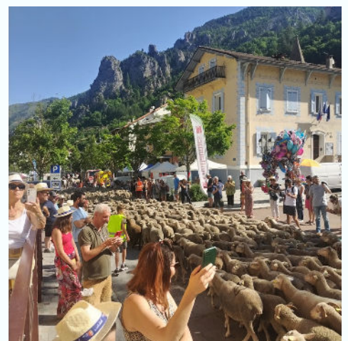
28/06 - Fête de la transhumance organisée par le conservatoire des traditions culinaires