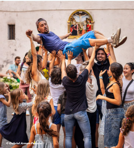
19/07 - 1er Festival Plein Air : une vraie réussite

Festivals et traditions colorent nos rues de musique, de saveurs et de rencontres. Le village s'anime au fil des arts et des gestes de convivialité, transformant chaque instant en fête.