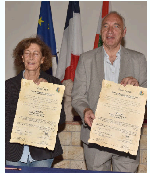
13/09 - Pacte d'amitié avec la commune Baakline du Liban sous l'égide de Mon Liban d'Azur