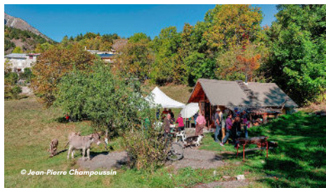
12/10 - Convivialité pour la fête de la Saint-Sauveur à Villeplane autour du four à pain