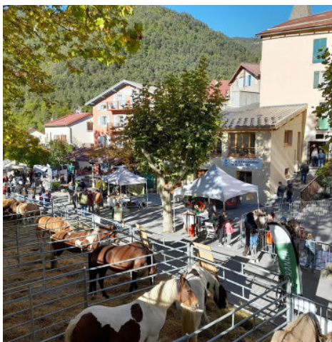
11/10 - La foire agricole comme autrefois