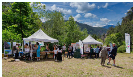
24/05 - Fête de la Nature : la biodiversité de notre territoire mise en valeur