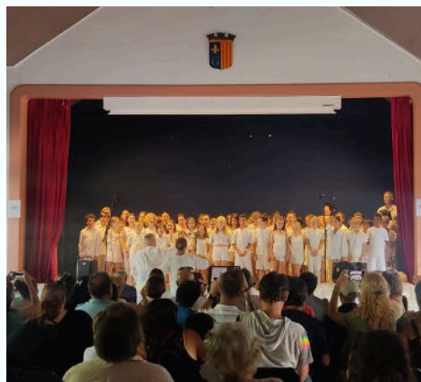
13/06 - Le concert des chorales des écoliers de la vallée organisé par l'inspection académique a réuni 300 enfants