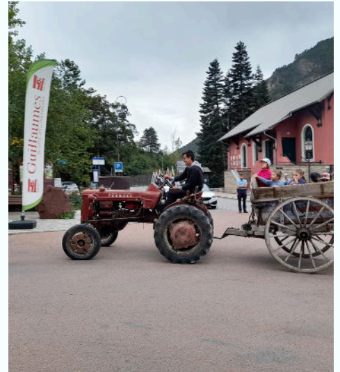
13/09 - Foire de la gastronomie et du terroir en collaboration avec le GEDAR