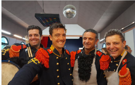
15/08 - Fête patronale Notre-Dame de l'Assomption : vive nos sapeurs de l'Empire !