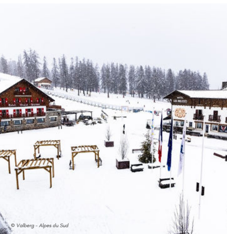
01/02 - Valberg sous son manteau blanc