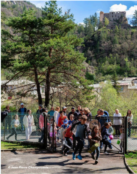
20/04 - La chasse aux œufs rassemble petits et grands