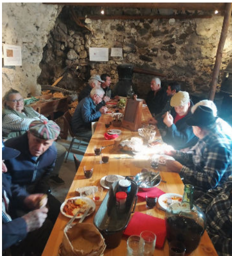
11/10 - Le traditionnel Goustaron pour la foire agricole

Le parfum des châtaignes rôties et du pain chaud se mêle aux couleurs des fêtes. Entre foire agricole, frissons d'Halloween et marché de Noël, la saison se déploie en lumières et en émotions.