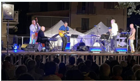
La culture à l'honneur avec les Estivales du département