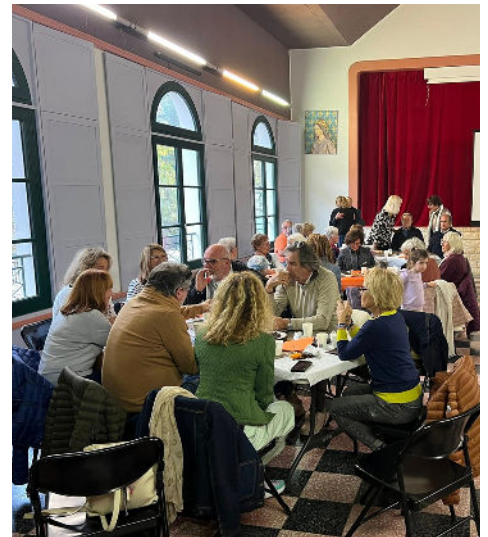
01/11 - Le Club Saint-Jean invite à déguster les châtaignes