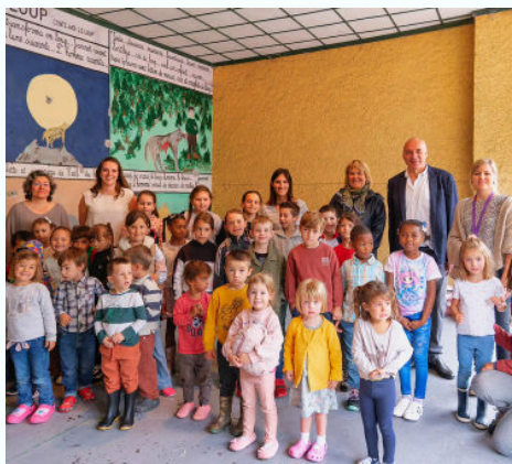
01/09 - Rentrée scolaire : 34 petits écoliers accueillis