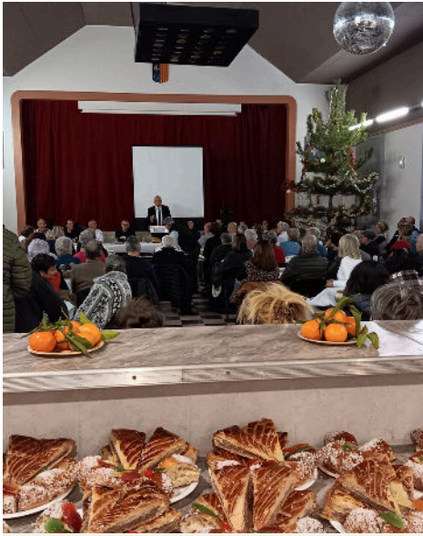
18/01 - Vœux du maire : galette et bonne humeur au rendez-vous