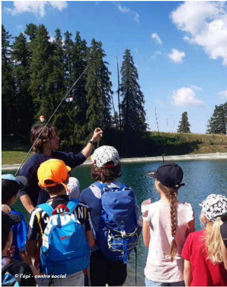
18/07 - Premiers lancers pour nos apprentis pêcheurs avec l'épi