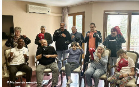
23/10 - Du sport pour nos seniors à la maison de retraite