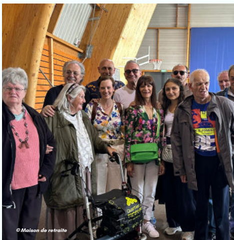
18/05 - Les années 80 : souvenirs partagés par nos aînés de la maison de retraite