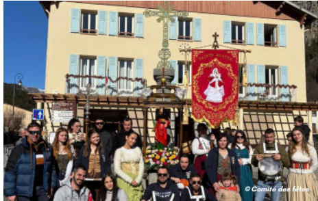
08/02 - Les femmes à l'honneur pour la Sainte-Agathe

Sous les premières neiges, le village partage et construit. Des vœux du maire à la fête de la Sainte-Agathe, du rire des enfants au chantier du château, cette saison unit chaleur humaine et fierté locale.