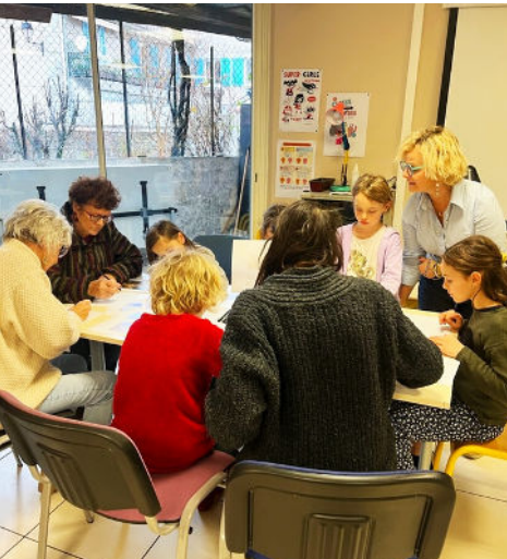
22/01 - Nuit de la lecture organisée à la Médiathèque communale de Guillaumes