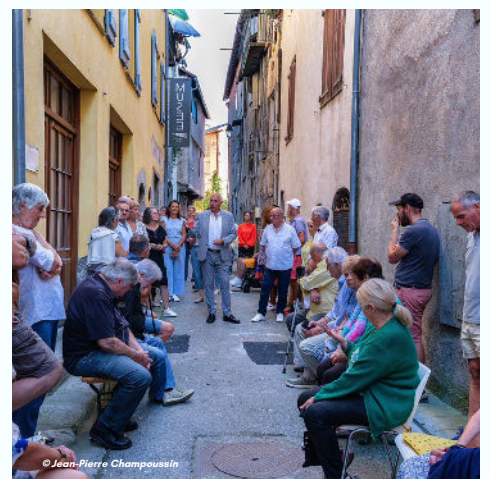
20/09 - Réouverture attendue du musée lors des Journées Européennes du Patrimoine