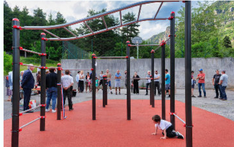
31/05 - Street Workout : le parc est officiellement ouvert