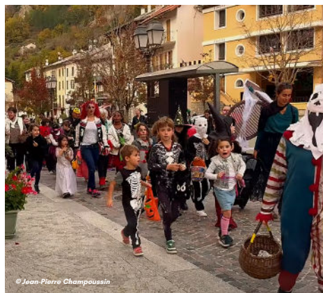
31/10 - Défilé de petits monstres pour Halloween organisé par l'épi