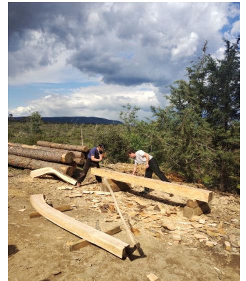
28/03 - Toiture du château réalisée par les charpentiers de Notre-Dame de Paris