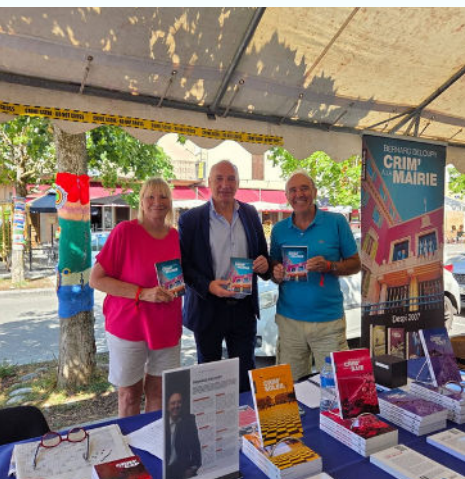
20/07 - 30ème édition du Festival du livre sur le thème de l'astronomie