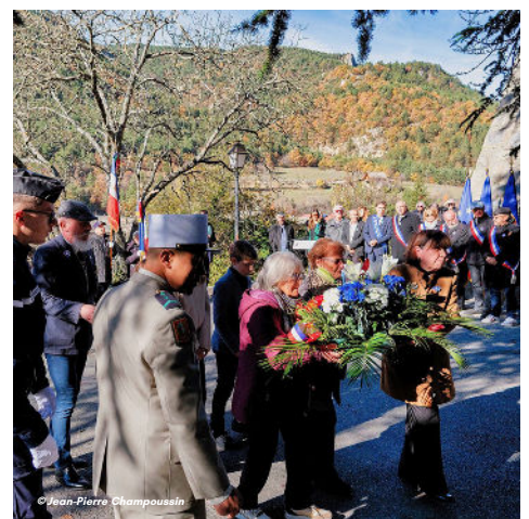
11/11 - Commémoration de l'armistice du 11 novembre 1918