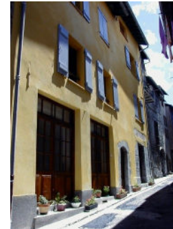
Musée des Arts et Traditions